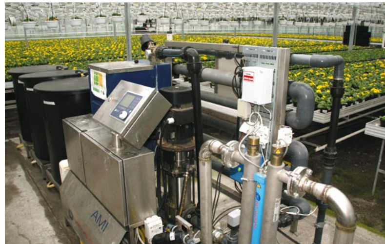
Den moderna datorstyrda recirkuleringen med UV-filter är lätt att sköta. Inget avlopp släpps ut och det går åt mindre gödselmedel.

På så vis kan såväl köpare som säljare känna sig trygga med att en rättvis värdering har gjorts, att